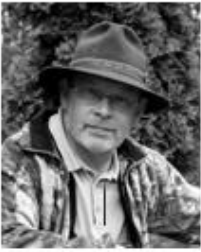
Steen er rejseleder på denne tur.