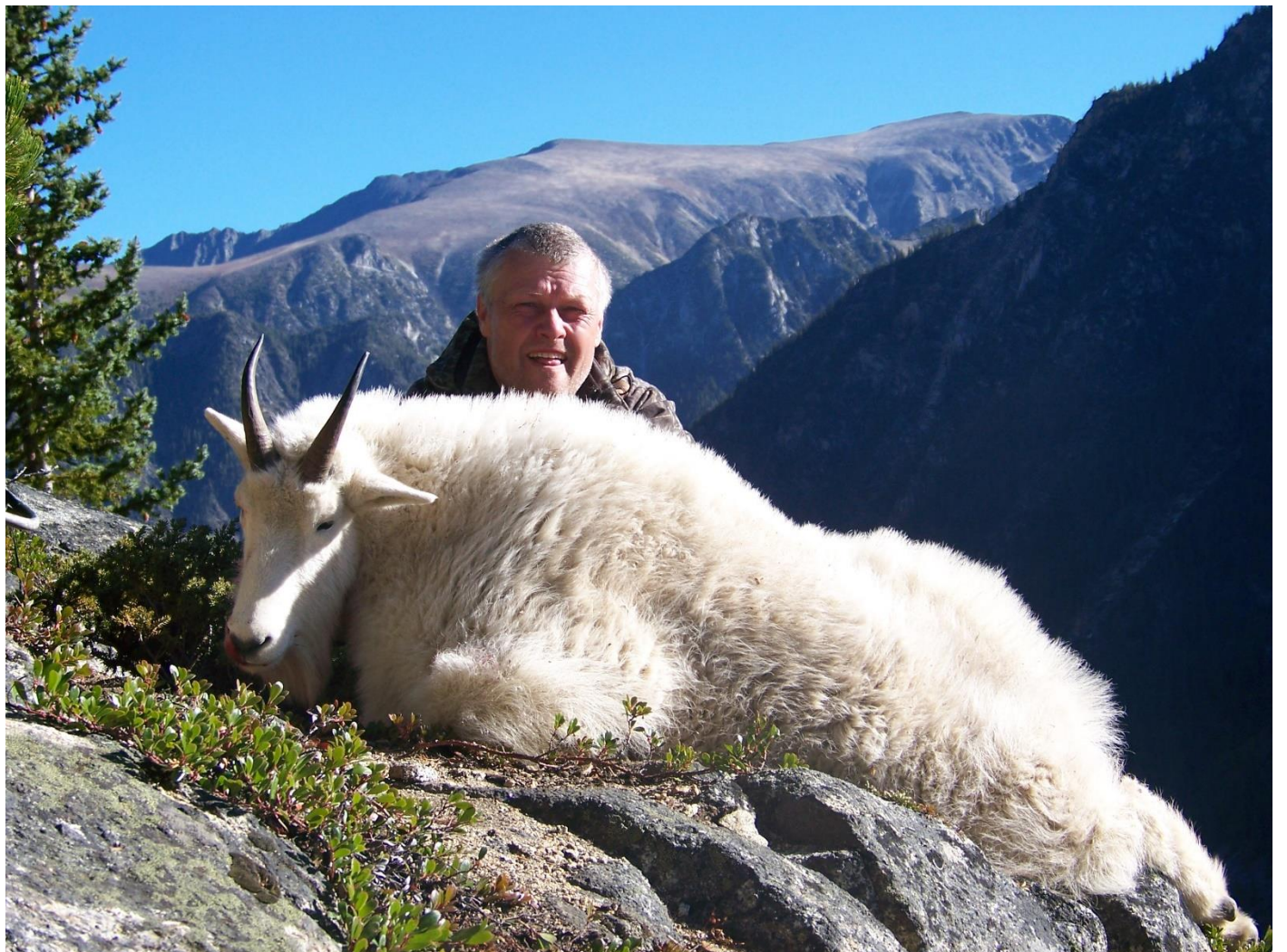
Gamekeeper & Buhls Jagtrejser A/S • Vejlevej 263 • 7323 Give tlf.: +45 76704100 • +45 97267418 • Jyske bank 7621 2128813