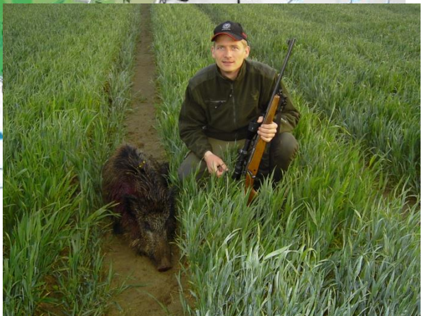
Gamekeeper & Buhls Jagtrejser A/S • Vejlevej 263 • DK-7323 Give tlf.: +45 76704100 • Jyske bank 7621 2128813